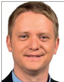
Jan Korte, stellvertretender Vorsitzender der Fraktion

Vielerorts engagieren sich Bürgerinnen und Bürger mit dem Ziel, Flüchtlinge willkommen zu heißen und sie in ihrem neuen Lebensalltag zu unterstützen. Das sind ganz konkrete und beeindruckende Signale der Offenheit für Schutzsuchende, die im Regelfall alles verloren haben und dringend unsere Unterstützung und Solidarität brauchen. Viele Menschen werden erstmalig aktiv, wenn in ihrer Nachbarschaft ein Asylheim entsteht. Andere wirken bereits seit Jahren in Flüchtlingsinitiativen, Kirchengemeinden oder in der Antifa mit. Dieses ganz praktische »Willkommen-Heißen« steht unserem Land gut zu Gesicht. Asyl ist Menschenrecht.